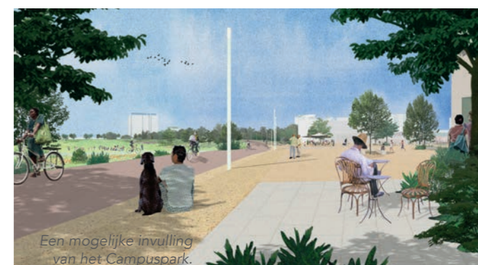
Een mogelijke invulling van het Campuspark.