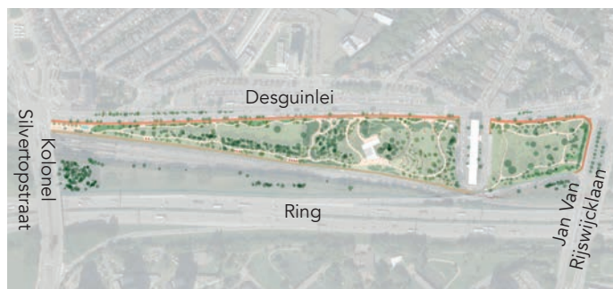
Concept voor Pomppark Zuid @ BUUR - Latz - Greisch - SWP - Antea - Levuur

Nu wordt het eerste deelproject, Pomppark Zuid gelegen tussen de Desguinlei en de spoorweg, verder uitgewerkt. Het voorontwerp zal in het voorjaar van 2022 voorgesteld worden aan de buurt.