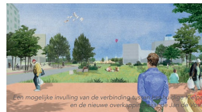
Een mogelijke invulling van de verbinding tussen het huidige Kielpark en de nieuwe overkapping naar de Jan de Voslei.