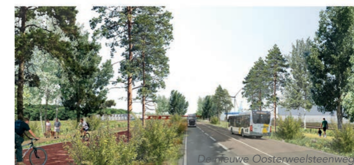
De nieuwe Oosterweelsteenweg.

Het SAMGA-plein, ter hoogte van de 19de-eeuwse SAMGA-silo, is de toegang naar het nieuwe park met een indrukwekkend zicht op de achterliggende haven.