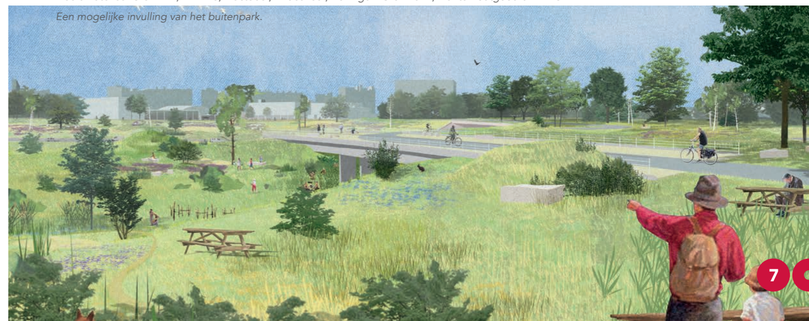
Een mogelijke invulling van het buitenpark.