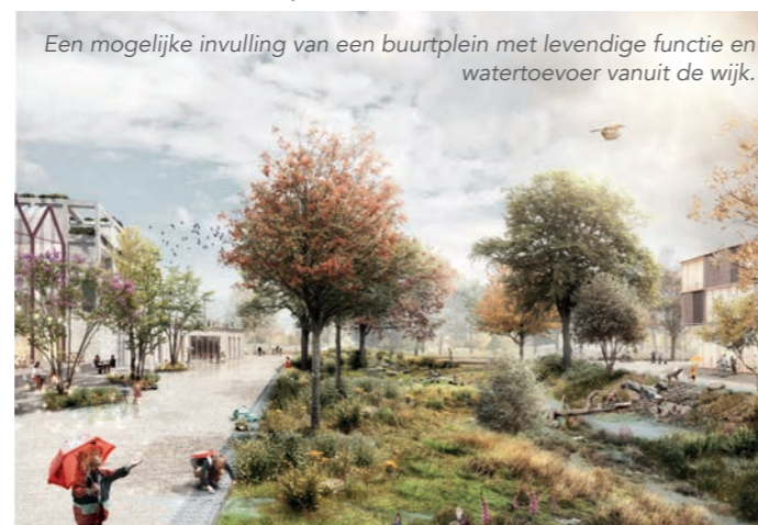
Een mogelijke invulling van een buurtplein met levendige functie en watertoevoer vanuit de wijk.