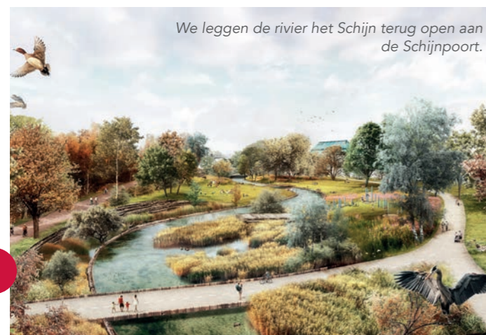
We leggen de rivier het Schijn terug open aan de Schijnpoort.

Op termijn wordt de hele Schijnvallei achter de Ten Eekhovewei een oase van groen om rustig te kuieren langs het water en waar ook de huidige volkstuintjes een plek krijgen.