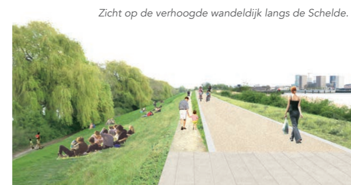
Zicht op de verhoogde wandeldijk langs de Schelde.

Als wandelaar of fietser kan je op de nieuwe dijk genieten van het prachtige panorama op de haven of de stad.