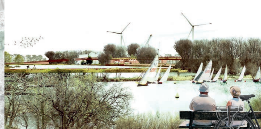
Zicht op de vijver aan het Noordkasteel.

Het Noordkasteel is uniek. Het is een monument voor cultuur en natuur in Antwerpen met een lange en rijke geschiedenis, een groene oase op de drempel tussen stad en haven.