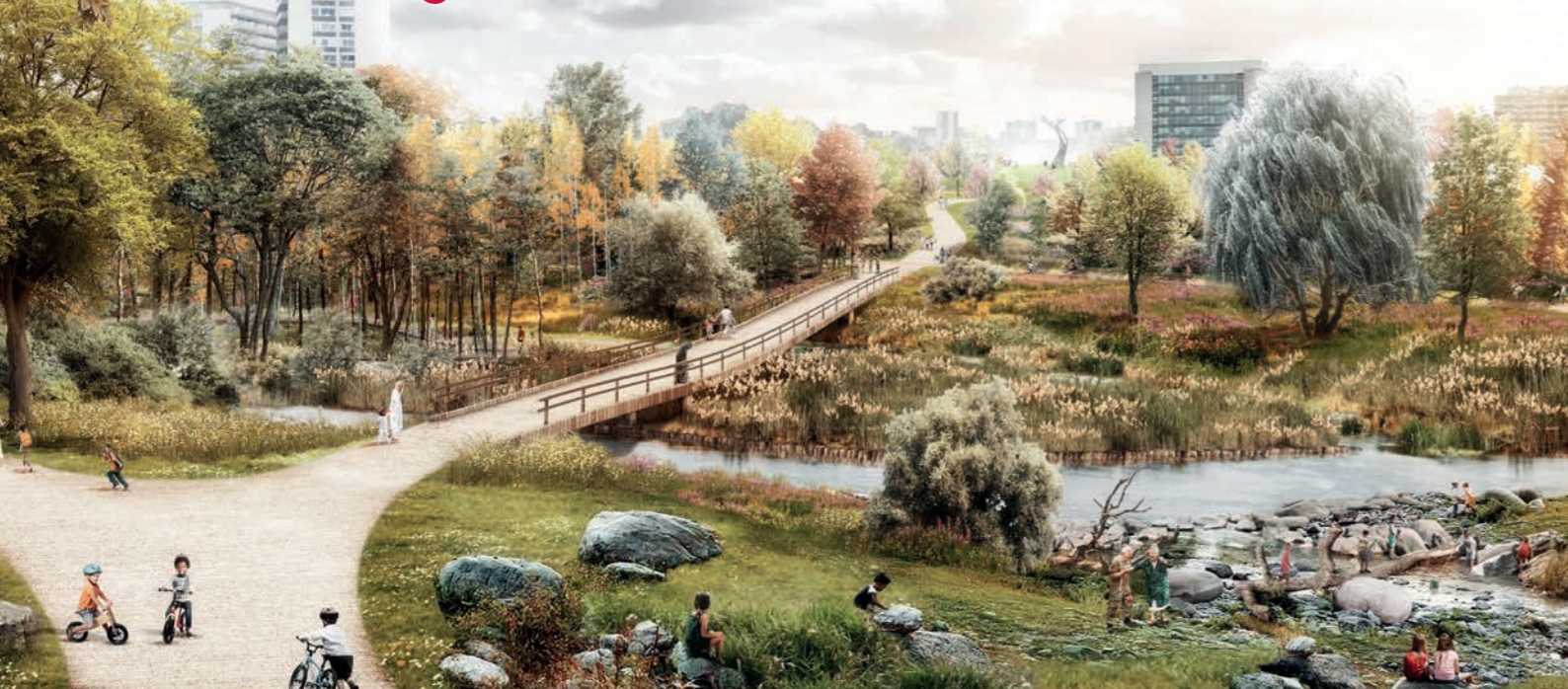
Het meanderend Schijn met de eilanden en zicht op kap Hof ter Lo.

Deurne en Borgerhout worden échte burens