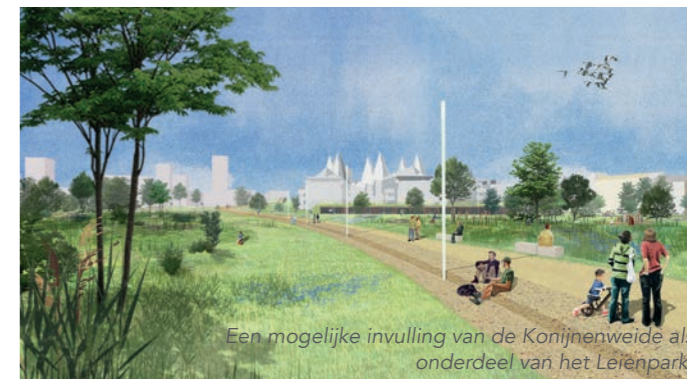
Een mogelijke invulling van de Konijnenwei als onderdeel van het Leienpark.

Het buitenpark is een 'toegankelijke wildernis', waar we uitgaan van de kenmerken van het bestaande groen en landschap. De buurtparken brengen het toekomstige park tot vlakbij de bebouwing. Het buitenpark maakt met zijn ecologische corridors de verbinding met het natuurgebied de Hobokense Polder.